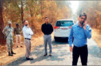
छोटी-बड़ी घटनाएं हो चुकी हैं, लेकिन अब तक कोई ठोस कदम नहीं उठाया गया।

हादसे के बाद शराब दुकान के आसपास मौजूद भीड़ और अव्यवस्थित यातायात को लेकर ग्रामीणों में भारी आक्रोश देखने को मिला। स्थानीय लोगों का कहना है कि शराब दुकान के पास दिनभर लोगों की आवाजाही बनी रहती है, जिससे सड़क पर जाम की स्थिति और दुर्घटनाओं का खतरा लगातार बना रहता है। ग्रामीणों ने आरोप लगाया कि पूर्व में भी इस स्थान पर कई